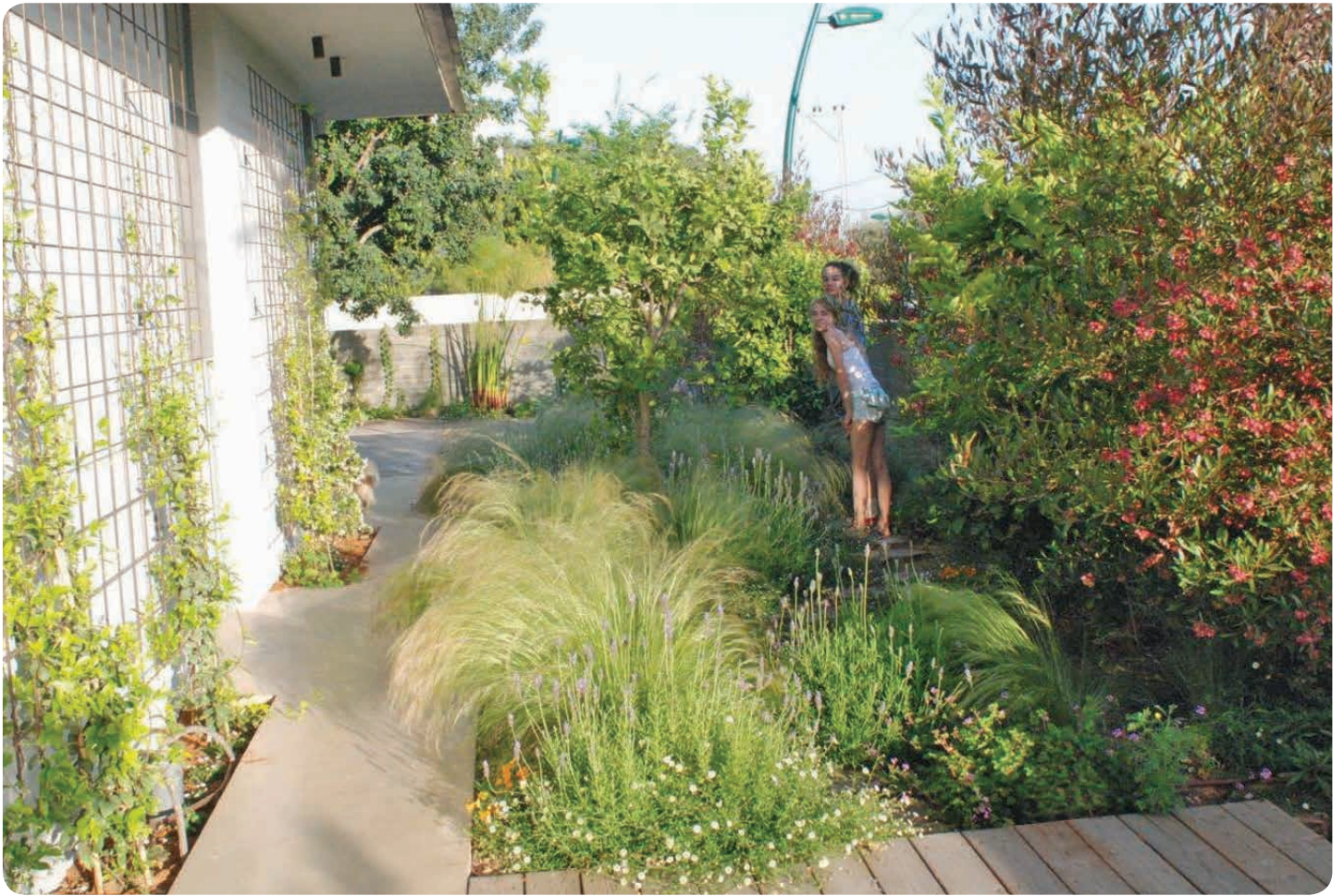
▲ בנות מטילות בגן הבוסתן, הטילול, והריח ▼ אריגרון קרוינסקי (ויטידיניה אוסטרלית)