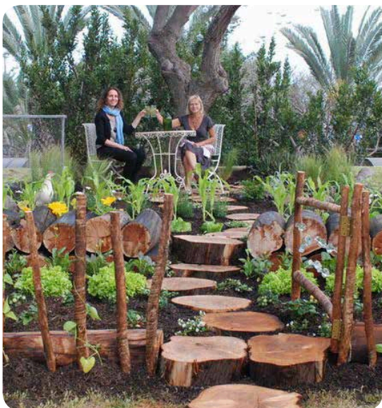
▲ גינה קטנה בתערוכה ברעננה (אפריל 2011)