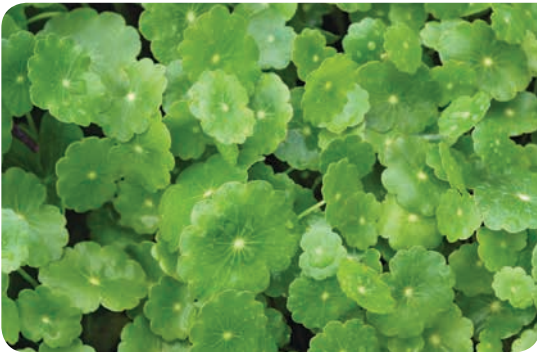
▲ ספלילה טבורית