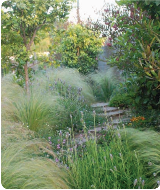
שביל משני בין בית לגדר