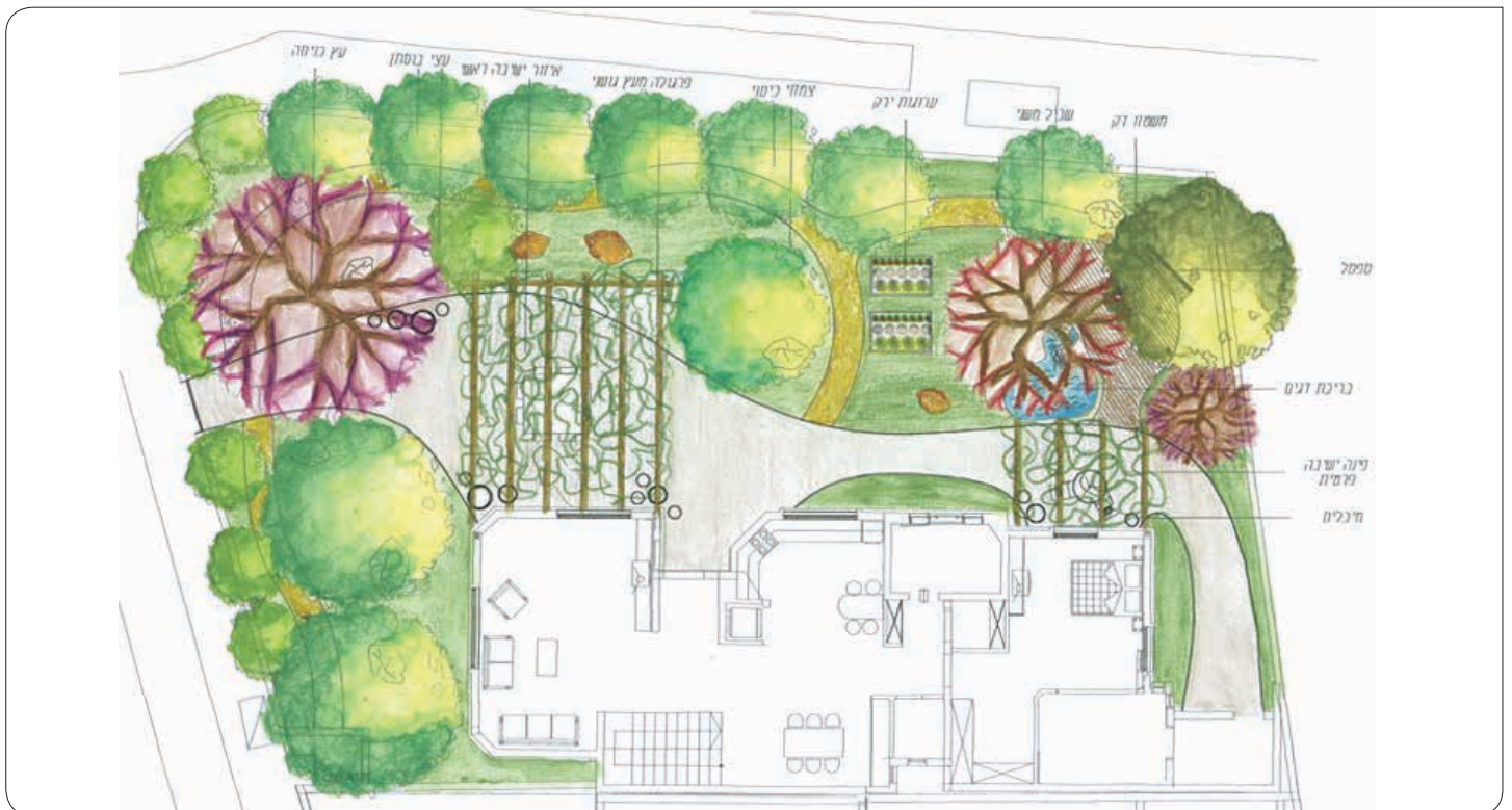
▼ תכנית של גן קטן