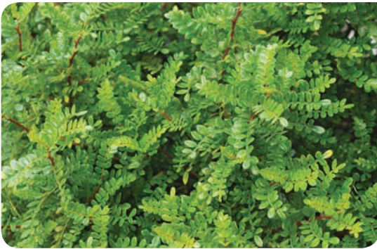
▲ אוסטאומליס / מפלון סיני

גן קטן מוגדר כגן ששטח האדמה בו הוא עד 100 מ"ר, אך גם פטיו, מספר מיכלים במרפסת, שטח מעבר בין שני חללים, חצר אנגלית, גרם מדרגות, רחבת כניסה לבית - כל אלו ועוד הם גן קטן