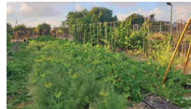
גינת הירק של הישוב