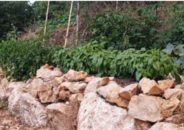
טרסה שילד בן 13 בנה וגין