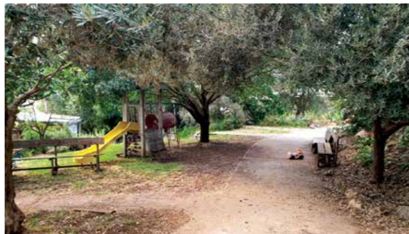
א גני שעשועים בצל חורש טיבני

אקולוגיה - השאיפה היא להשתלב בתוך יער האלוניים שבתוכו הוקם הקיבוץ, ולהימנע מפגיעה בסביבה עד כמה שניתן. הקיבוץ מקיים ומעודד מגוון פעילויות התומכות באורח חיים אקולוגי: