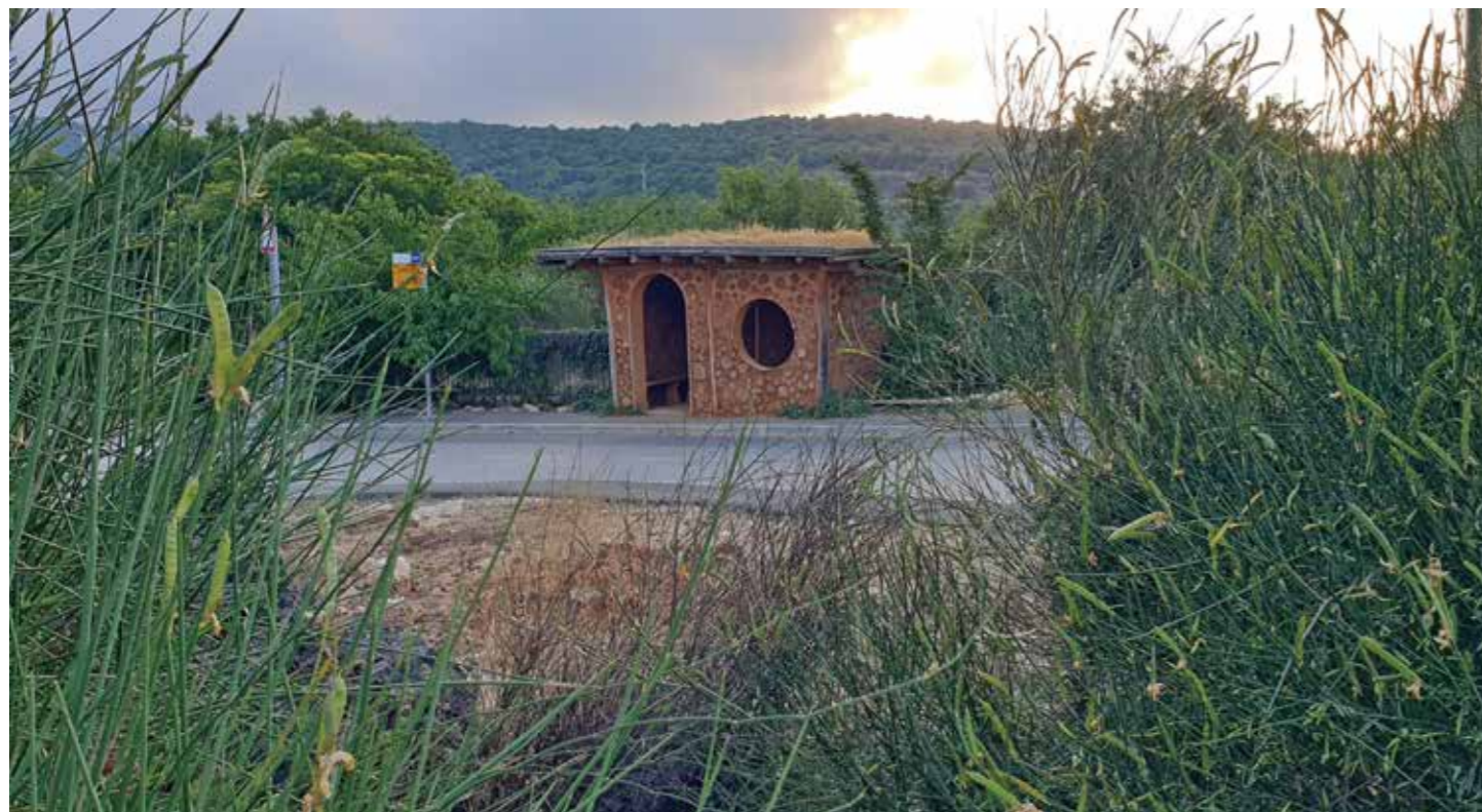
תחנת ההסעות בכניסה ליישוב, בניה עצמית בבוקר, גג ירוק