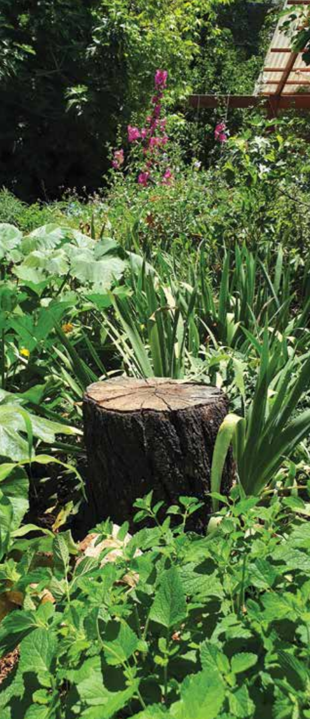
א צומח ודומם בפינה בגינה פרטית

צבעון הינו קיבוץ מתחדש, הקהילה פועלת למימוש עקרונות חברתיים של ערבות הדדית, חיי קהילה ותרבות מקומיים ויזמות שיתופיות